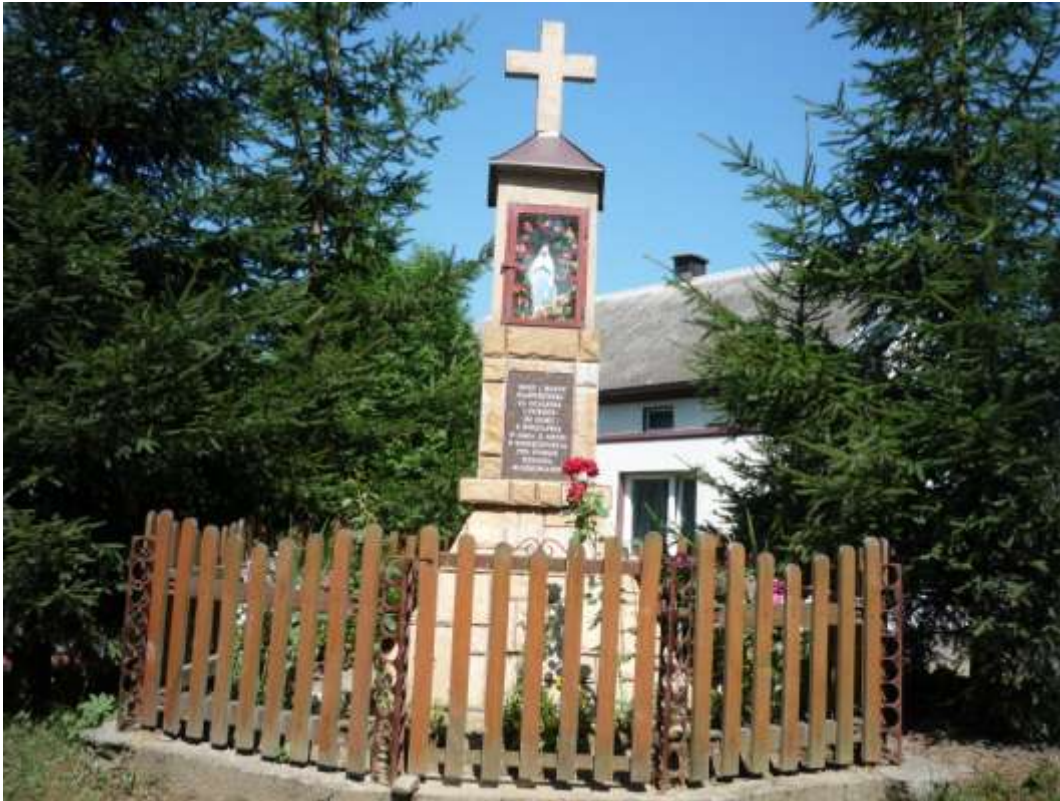
Kapliczka wotywna tzw. wrocławska