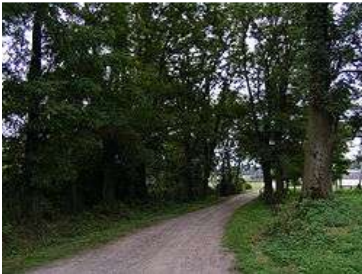
Aleja w Jasionach w dawnym majątku Irzykowskich.

W Błażkowej urodził się 23 stycznia 1873 r. Karol Irzykowski krytyk literacki, pisarz, autor powieści Pałuba . Zmarł 2 listopada 1944 r. w Żyrardowie. Dworek Jasiony, w którym urodził się pisarz, został rozebrany po 1945 r. W jego miejscu stoi dziś tartak. Pozostały: aleja, którą powozy zajeżdżały przed ganek, kilka drzew oraz wspaniałe widoki na Liwocz i dolinę Wisłoki.