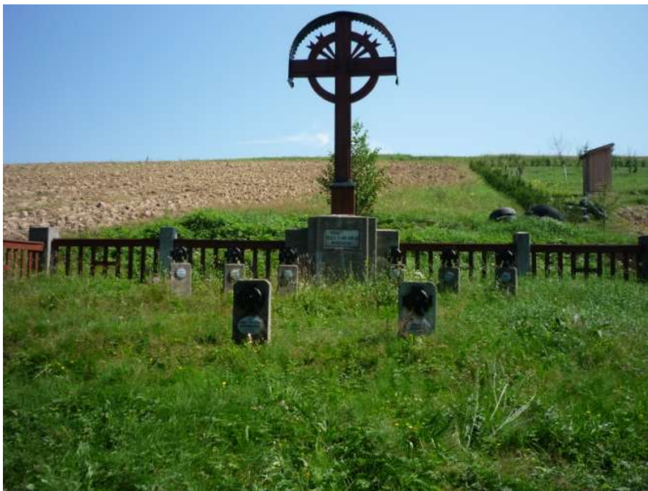
Jeden z Cmentarzy z okresu I wojny światowej

XX wiek doświadcza szczególnie Błażkową podobnie jak okoliczne miejscowości i miasto Jasło. 18 do 22 grudnia 1914r. i 2 do 9 maja 1915 roku toczą się potężne bitwy w pobliżu Błażkowej. Ze były krwawe świadczą pozostałe do dziś cmentarze wojenne z tego okresu cmentarz nr 219 i Cmentarz nr 229. Pochowani są tu zarówno żołnierze armii austrowęgierskiej jak i armii rosyjskiej.