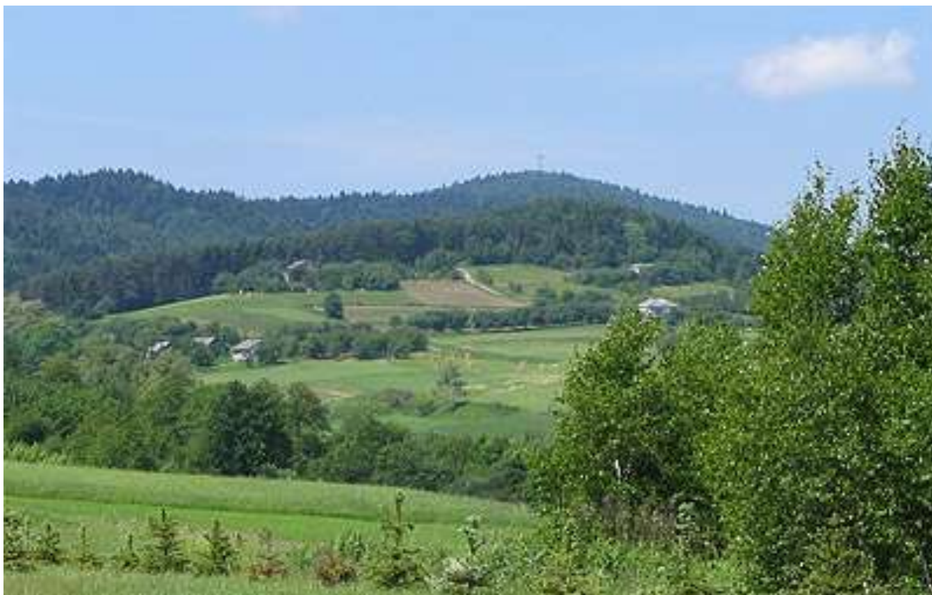
Widok na Liwocz z Błażkowej

Sanktuarium Chrystusowego Krzyża i Matki Bożej Królowej Pokoju z Medziugorje.