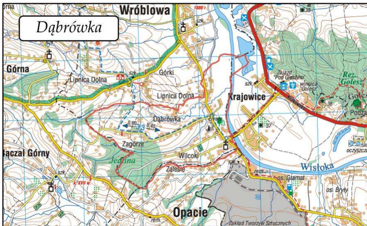
Rysunek nr 1. Położenie wsi Dąbrówka.

Zgodnie z prowadzoną przez miejscowy urząd ewidencją działalności gospodarczej, na terenie Dąbrówki zarejestrowanych jest 25 podmiotów gospodarczych, z czego 10 zajmuje się handlem i usługami, a tylko 1 prowadzi działalność wytwórczo- przemysłową. (stan na 31.12.2008- dane USC Brzyska).