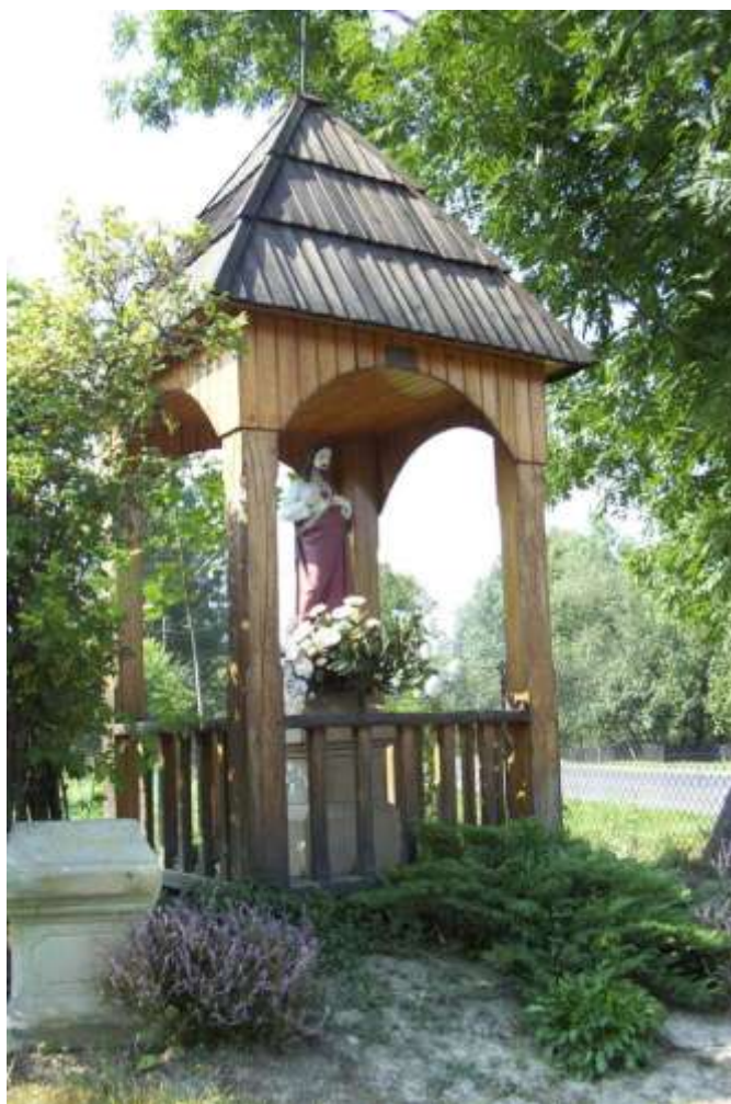
Zdjęcie nr 3. Zabytkowa kapliczka Serca Pana Jezusa z 1905r.

Na szczególną uwagę zasługują jedynie obiekty małej architektury sakralnej tj: kapliczki i krzyże przydrożne.