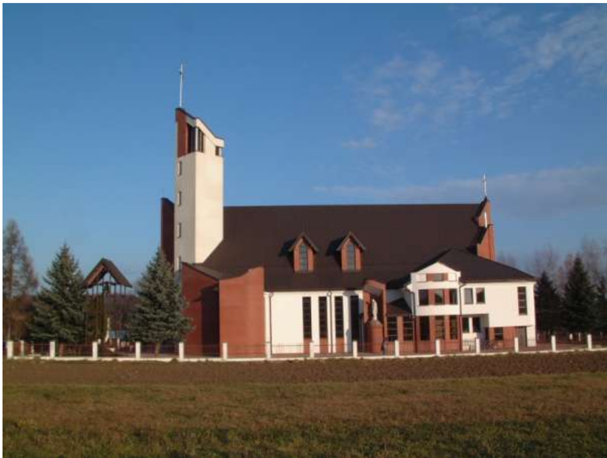
Rysunek nr 2. Kościół parafialny w Dąbrówce.

Ponadto na terenie wsi znajdują się stawy rybne, które wraz z rzeką Wisłoką dają atrakcyjne połączenie i możliwości spędzenia wolnego czasu.