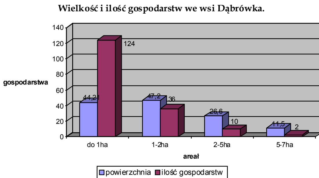
Wykres nr 2. Struktura gospodarstw w sołectwie Dąbrówka.

Źródło: Urząd Gminy w Brzyskach- sekcja podatkowa (dane na 01.04.2010r).